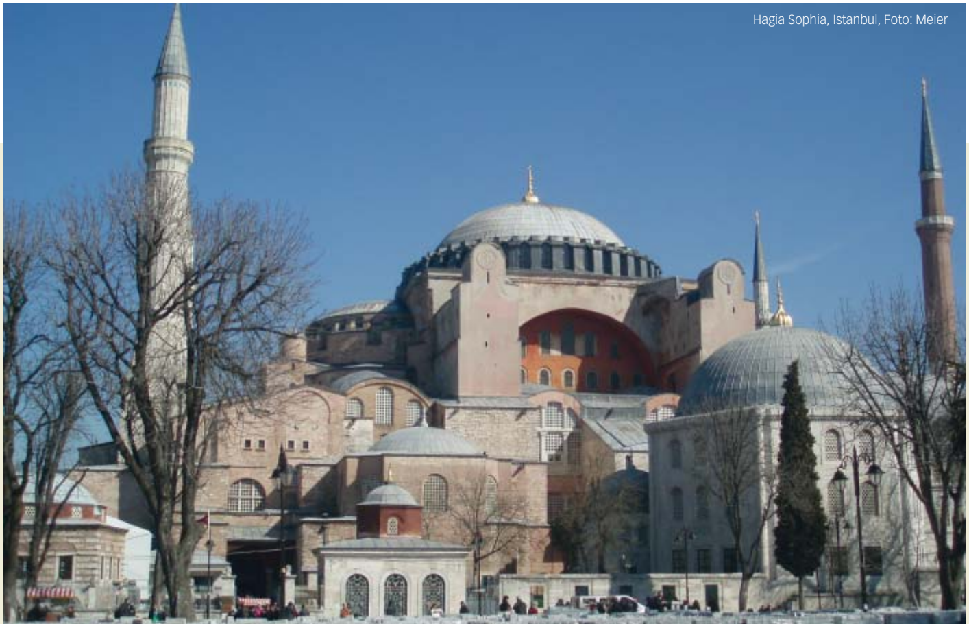
Hagia Sophia, Istanbul

(565–577) identifiziert, doch ist diese Annahme eher unwahrscheinlich. Fraglich ist ebenfalls, ob Johannes Malalas der christlichen ‚Einnaturenlehre‘ (Miaphysitismus) zuneigte, wie einige Forscher aufgrund des Werkes annehmen. Vermutlich ab der Zeit 528/32 lebte Malalas in Konstantinopel, im Zentrum des Oströmischen Reiches; dieser Ortswechsel kann aus der Chronik erschlossen werden, da ab diesem Zeitpunkt nicht mehr Antiocheia, sondern Konstantinopel im Mittelpunkt der Darstellung steht.