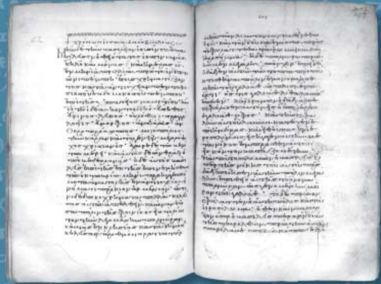
Handschrift: MS. Baroccianus 182

Vorrangiges Ziel des Projektes ist die Erarbeitung eines historisch-philologischen Kommentars zur Chronik des Johannes Malalas. Mit diesem Kommentar soll ein Arbeitsinstrument vorgelegt werden, das den Zugang zu diesem wichtigen Werk erleichtert und eine fundierte wissenschaftliche Auseinandersetzung mit ihm ermöglicht. Der Kommentar soll aus historischer, philologischer, kirchengeschichtlicher und archäologischer Perspektive sprachliche und inhaltliche Aspekte gleichermaßen behandeln. Zunächst wird der Kommentar in einer internetbasierten Datenbank entstehen, um die nötige Flexibilität für ständige Überarbeitungen zu gewährleisten und auch zum Zeitpunkt des Abschlusses des Gesamtprojekts in den ersten Kommentarteilen noch aktuell zu sein. Abschließend soll eine Endversion in Buchform vorgelegt werden. Begleitend zum Kommentar erfolgt eine Auseinandersetzung mit wesentlichen Fragen der Malalas-Forschung, so etwa zur Überlieferungsgeschichte, zur Frage der Quellen, zu den sprachlichen Eigentümlichkeiten der Chronik sowie zum Verhältnis zu späteren byzantinischen Chroniken. Die Einzelstudien zu diesen und anderen Fragekomplexen sollen den Kommentar ergänzen, aufgrund der fokussierten Fragehorizonte bereichern und ihm Impulse aus der aktuellen Forschung verleihen; der Kommentar wird aus diesen Arbeiten Anregungen inhaltlicher und insbesondere auch methodischer Natur beziehen können.