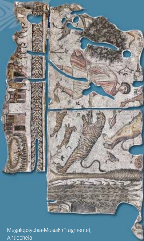
Megalopsychia-Mosaik (Fragmente), Antiocheia

Aufgrund der komplizierten Überlieferungslage und der in der Forschung lange vorherrschenden Geringschätzung der Gattung ‚Chronik‘ konnte das bedeutende Werk des Malalas bisher noch nicht in der erforderlichen Weise erschlossen werden. Hierfür soll der geplante historisch-philologische Kommentar eine erste Grundlage schaffen. Das Projekt umfasst die Fachgebiete Alte Geschichte, Klassische Philologie, Alte Kirchengeschichte, Klassische Archäologie und Byzantinistik.